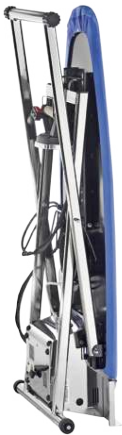
Chiuso - Closed

TAVOLO DA STIRO PIEGHEVOLE, ASPIRANTE, SOFFIANTE, RISCALDATO, CON CALDAIA INOX MANUALE E FERRO DA STIRO HEATED, VACUUM AND BLOWING FOLDABLE IRONING BOARD WITH IRON AND MANUAL STAINLESS STEEL BOILER