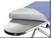
Piano stiro in alluminio Aluminium ironing board