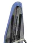
Molla a gas Gas spring