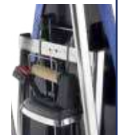
Supporto ferro Iron support