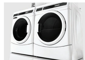
DISPONIBILE LA LAVATRICE