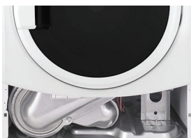
ACCESSO FRONTALE DEL PANNELLO