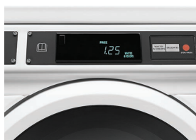
SELEZIONE FACILE DEL CICLO